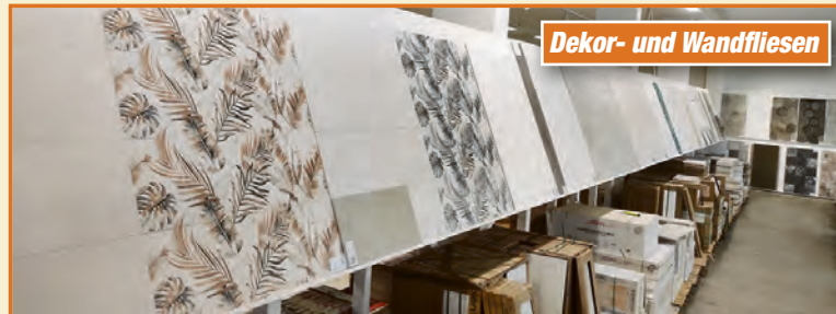
Dekor- und Wandfliesen