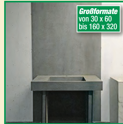
Großformate von 30 x 60 bis 160 x 320